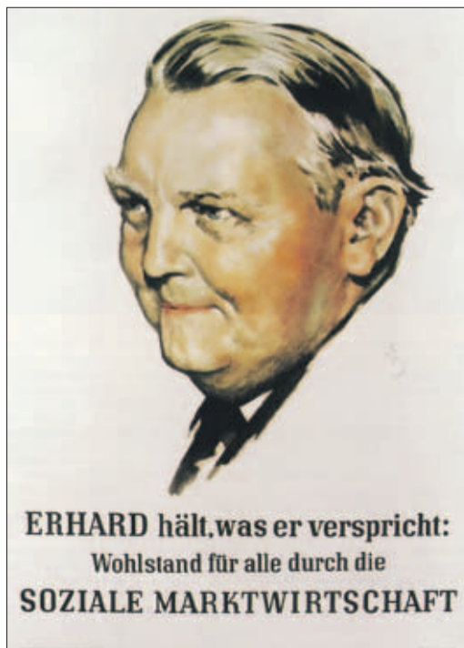
Immer weniger glauben dem Versprechen: Wahlplakat aus dem Jahr 1957.