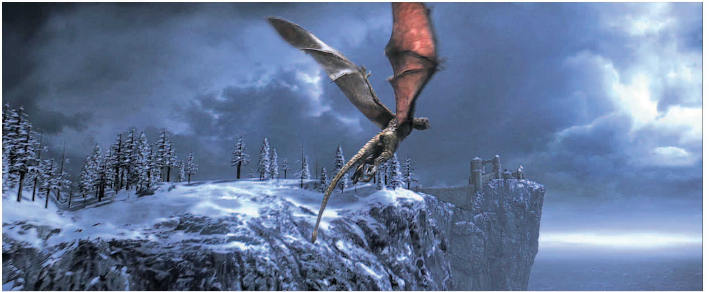
Nicht nur computeranimierte fliegende Monster bevölkern den Fantasy-Film „Die Legende von Beowulf“ von Robert Zemeckis, der diese Woche in die deutschen und amerikanischen Kinos kommt